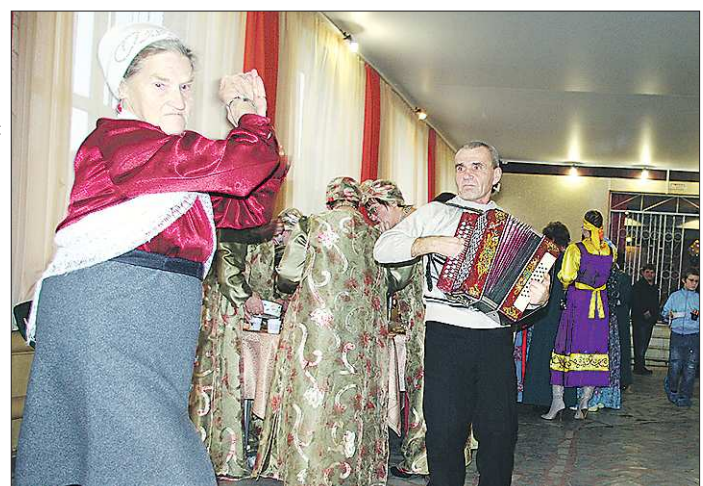
Под вятские наигрыши на тульской гармонии не только душа поёт, но и ноги сами пускаются в пляс