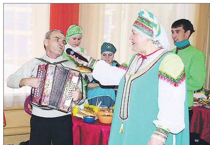
Если не смотреть на руки этого баяниста, догадаться о том, что у него нет пальцев, практически невозможно

За водой верхнейвинские домохозяйки теперь отправляются с персональным ключом