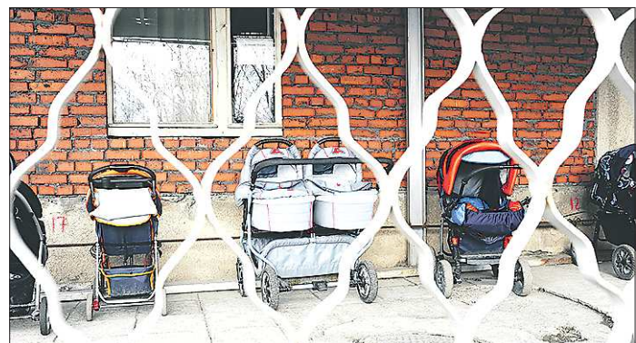
В минувшем году Алапаевский ЗАГС зарегистрировал рождение трёх пар двойняшек. Это довольно скромный показатель: в 2007-м и 2011 году аист приносил в этот город по шесть новорождённых «тандемов»