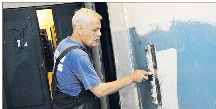
В области 65149 многоквартирных домов построены до 1970 года, косметическим ремонтом в них не обойтись

По предварительным данным, включению в региональную программу капитального ремонта многоквартирных домов подлежат порядка 100 тысяч домов. А на сегодняшний день жилищно-коммунальный комплекс Свердловской области включает более 107 тысяч многоквартирных домов, так что понятно — этот вопрос волнует большинство уральцев.