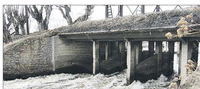
Необходимо чётко представлять оставшийся срок безопасной эксплуатации каждой плотины

Государство сейчас ещё обещает помогать деньгами региональным Фондам, но размер и даже пропорции такой помощи очень и очень неопределённые. Так что надеяться собственникам придётся больше на собственные силы, а фонды обещают сохранить собранные средства и жёстко контролировать подрядчиков. Впрочем, к этой работе они призывают и активных жильцов.