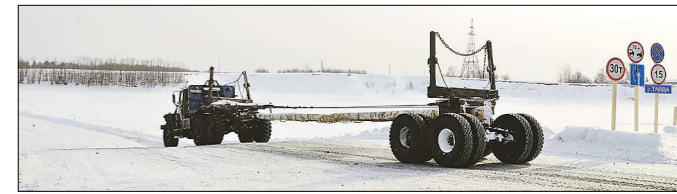
Ледовая переправа для таборинцев до весны — поистине дорога жизни