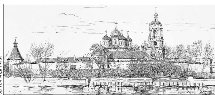
Тела погибших Михаила, Александра и Василия Романовых в 1606 году были перезахоронены в Новоспасском монастыре Москвы, где похоронен их отец

Ну а выше остальных сумел подняться Фёдор Романов, который стал в 1619 году Патриархом Московским и всея Руси Филаретом, а его сын Михаил — первым царём династии Романовых.