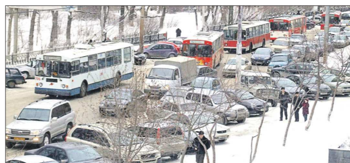
Часто водители оставляют машины в неполюженном месте не потому, что они по природе своей — нарушители порядка, а потому, что припарковаться негде