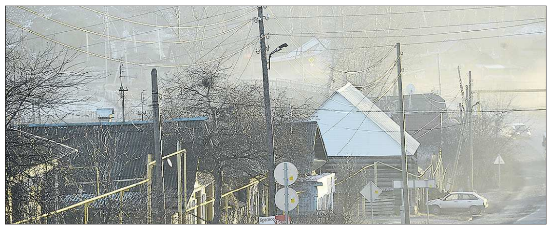
Плата за свет не так уж высока. Или похитители действуют ради спортивного интереса?

— Прийти к нам можно, как известно, без предварительной записи. Такая возможность дорогого стоит, и посетители ею пользуются, чтобы поделиться с нами проблемами. В здания, где работают органы власти, попасть сложнее, поэтому высокопоставленные руководители часто встречаются с населением в наших стенах. Узнать о графике приёма можно по телефону (343) 355-11-41, а написать электронное письмо по адресу: opr66@edinoros.ru .