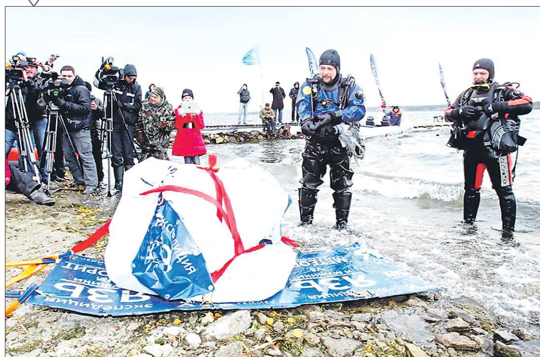
Год назад, утром 15 февраля 2013 года, в небе над Уралом пронеслось и взорвалось небесное тело, которое потом назвали Челябинским метеоритом. В октябре прошлого года самый крупный кусок этой глыбы весом 654 килограмма (на снимке) екатеринбургские водолазы достали из озера Чебаркуль. Сегодня он красуется в Челябинском краеведческом музее. А накануне первой годовщины падения метеорита учёные рассказали о своих сенсационных предположениях и выводах