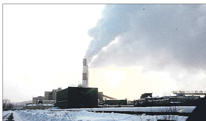
Жители Верхнего Тагила очень волнуют экология города, а с новым парогазовым энергоблоком ГРЭС уменьшит выбросы в атмосферу

— Земляника поспеет одной из первых, думаю, успею. Уже сейчас наделаем варенья на эти заготовки. Кстати, в прошлом году фестиваль сопровождала ярмарка народных промыслов. Многие туристы с удовольствием покупали дары садов и огородов. А в этом году каждый турист сможет увезти с собой баночку камышловского земляничного джема.