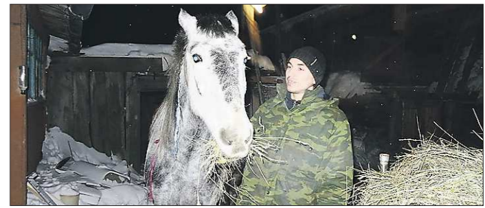
Пятилетняя кобыла Рада — создание нежное, любит целоваться с хозяином. Однако перед лицом опасности она повела себя как истинный боец

На Олимпийском проспекте пока не появились портреты хоккеиста Александра Радулова и лыжницы Евгении Шаповаловой. Но тагильчане очень-очень этого ждут, ведь Александр и Евгения — их земляки