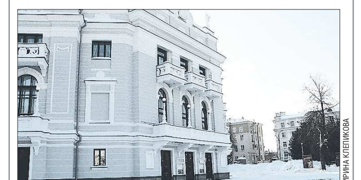
«Ба! Академик» без диплома»

Во всяком случае, именно так написано в нынешнем, за 2014 год, календаре-справочнике «Знаменательные и памятные даты Свердловской области», который издаётся областным Управлением архивами. Источник серьёзный (и сам календарь, и архивное ведомство), однако у театралов дата вызвала изумление. Общеизвестно: звание «академический» присвоено нашему Оперному в 1966 году. Первая мысль: звание присвоено в 1966-м, а диплом (по каким-либо причинам) вручили позже. Однако восемь лет (I) — не слишком ли длинная и парадоксальная дистанция в пределах одного государства? От Москвы до Урала — сутки езды, лёту — того меньше... Ирина КЛЕПИКОВА