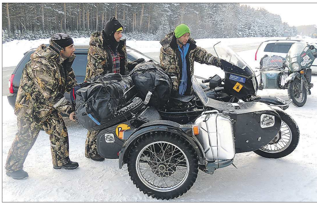
Перед стартом иностранные байкеры несколько дней провели в Ирбите — готовили технику, совершали тренировочные выезды. И всё-таки без сюрпризов не обошлось...