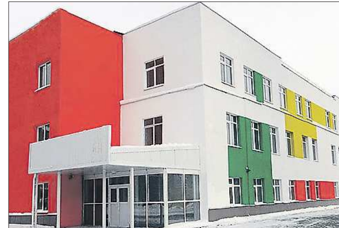
Новый детский сад в Верхней Пышме уже принял 220 воспитанников, из которых сформировано девять групп