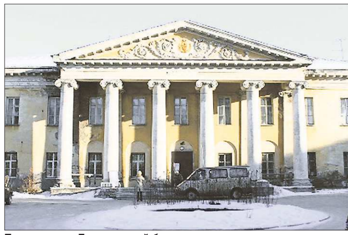
Поликлиника Демидовской больницы расположена в здании, возведённом в 1830 году. Удивительно, но это здание сохранилось лучше, чем постройки середины прошлого века