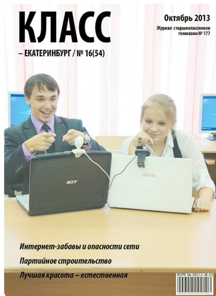
Журнал «Класс» гимназии №177, г.Екатеринбург

— Редактором школьной газеты должен быть школьник, но без взрослого куратора не обойтись. Есть масса проблем, которые дети не могут решить сами в силу отсутствия правового статуса. Речь идёт, например, о защите чести и достоинства. Бывает, что на материалы в школьной газете кто-то обижается. В частности, самые обидчивые люди на свете — учителя. Дети бесправны, а взрослый человек может взять на себя ответственность, защитить юного журналиста. Вместе с тем учитель не может быть редактором, так как он по-другому понимает те вещи, которые волнуют школьников, у него иной взгляд.