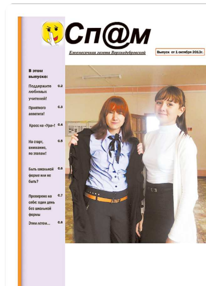
Газета «Спам» школы посёлка Верхнее Дуброво

Вопрос читателям: что бы вы разместили на первой полосе в газете в своей школе?