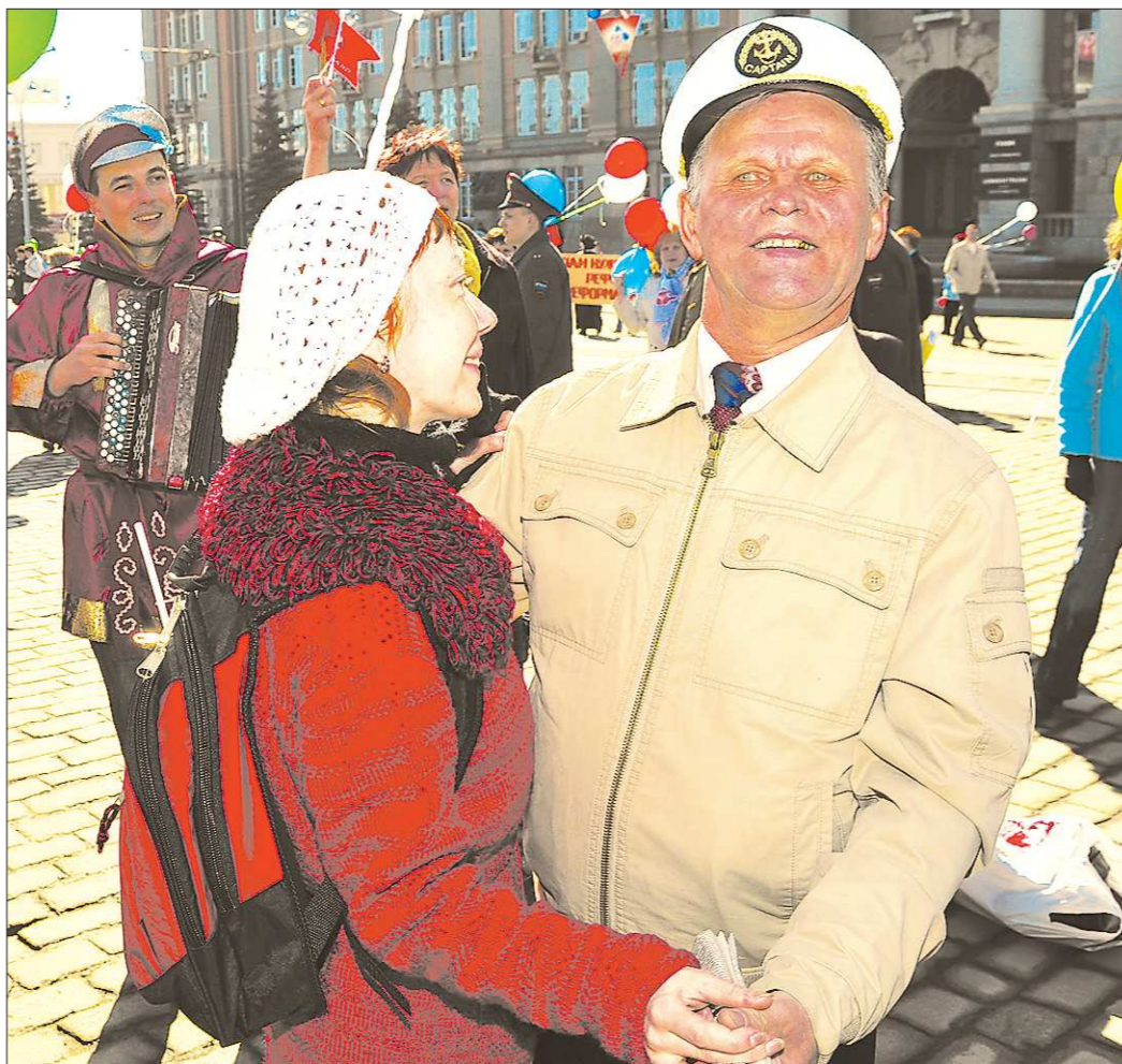
Пенсионеры и пожилые – это не одно и то же. Среди первых немало 50- и даже 40-летних