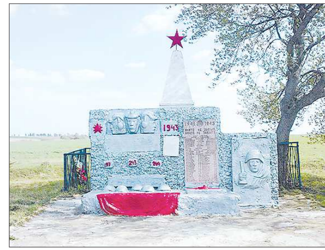
Памятник уральским танкистам в Боролово. В боях за это село бравшая его 197-я (Свердловская) танковая бригада понесла очень серьёзные потери