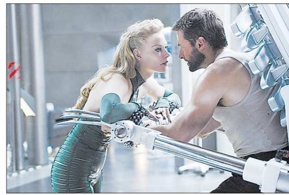
КДК из фильма

На нашем сайте http://www.oblgazeta.ru вы также можете ознакомиться с трейлерами картин.