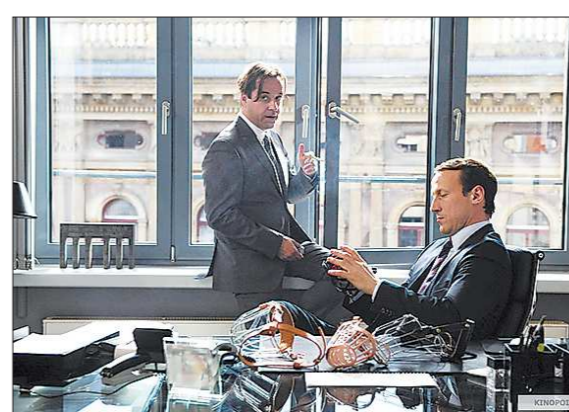
КДК из фильма