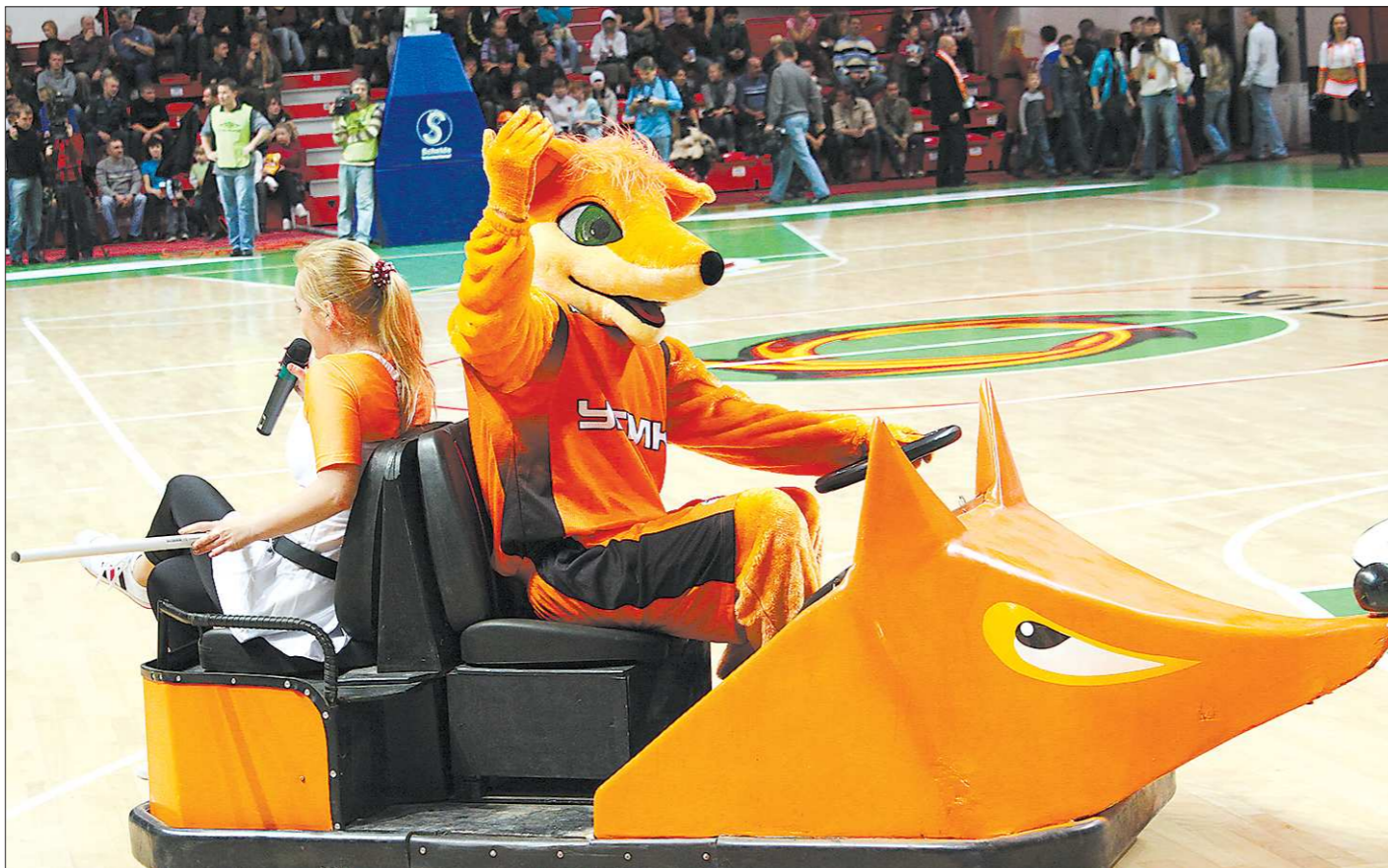
Куда увезут «лисицы» российский женский баскетбол?

«Пожалуйста. Женские баскетбольные клубы не в силах выдерживать финансовое бремя, которое заложено в существующем регламенте. По этой причине ушли в низшие лиги питерский «Спартак», «Ростов-Дон», московский «Спартак-ШВСМ». В свою очередь, команды из суперлиги отказываются от участия