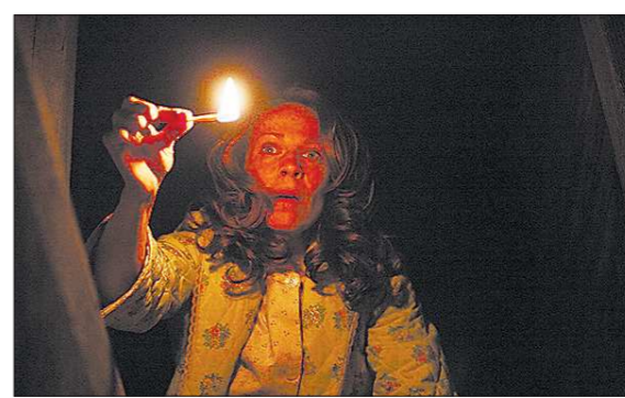
КДК из фильма