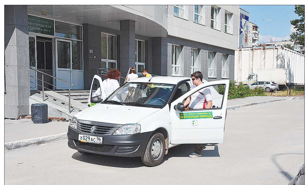
Новый проект – хорошо забытое старое: до 90-х «неотложки» работали во всех подразделениях амбулаторно-поликлинических служб России