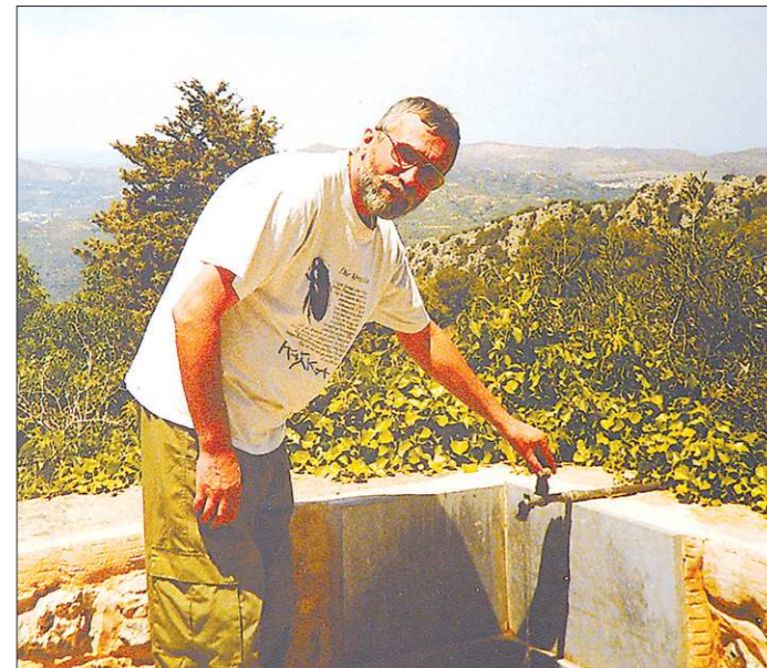
Германия. Университет в Гейдельберге. На футболе – начало культурного рассказа Кафки «Превращение»

– Любимое время суток? – С десяти до полпервого ночи. Старую всё забыть. Готовлю. Люблю крымские вина. Если на даче, то – сауна. В общем, время «распуститься». – Место, где вы наиболее адекватны самому себе? – На улице. В толпе. Что-то бормочу про себя или напевая. Прилюдно-то петь не рискну – у меня слух нет. – Если надо выполнить нежелательную работу, то... – Стараюсь сбросить её на других. Иначе заболлеваю. Я трус (смеётся): боюсь делать то, что не люблю. – Как выходите из депрессии или усталости? – Ложусь и долго лежу, глядя в потолок. Через полчаса надоедает, хочется встать и что-то делать. – Книжки, к которым можете обращаться много раз? – У меня Пушкин стоит везде, Шекспир. Перед выходом на работу прочитываете страничку – и несёшь в себе эти строки. ...Знаете, Хэмингуэй, сколько ни переиздавал, возил за собой один и те же 5-6 книг. Евангелие, Толстой, Джойс... Читал их лучшими творениями и перечитывал крошечными кусочками. – Книжки пишите от руки? – Только! Потом заставляю себя сесть за компьютер. Я в жизни не написал ни одной СМС-ки. Не хочется. Люблю живое общение. – Часы – стимулирующий или раздражающий фактор? – До 60-ти я их не замечал. Сейчас раздражают. Идут слишком быстро.