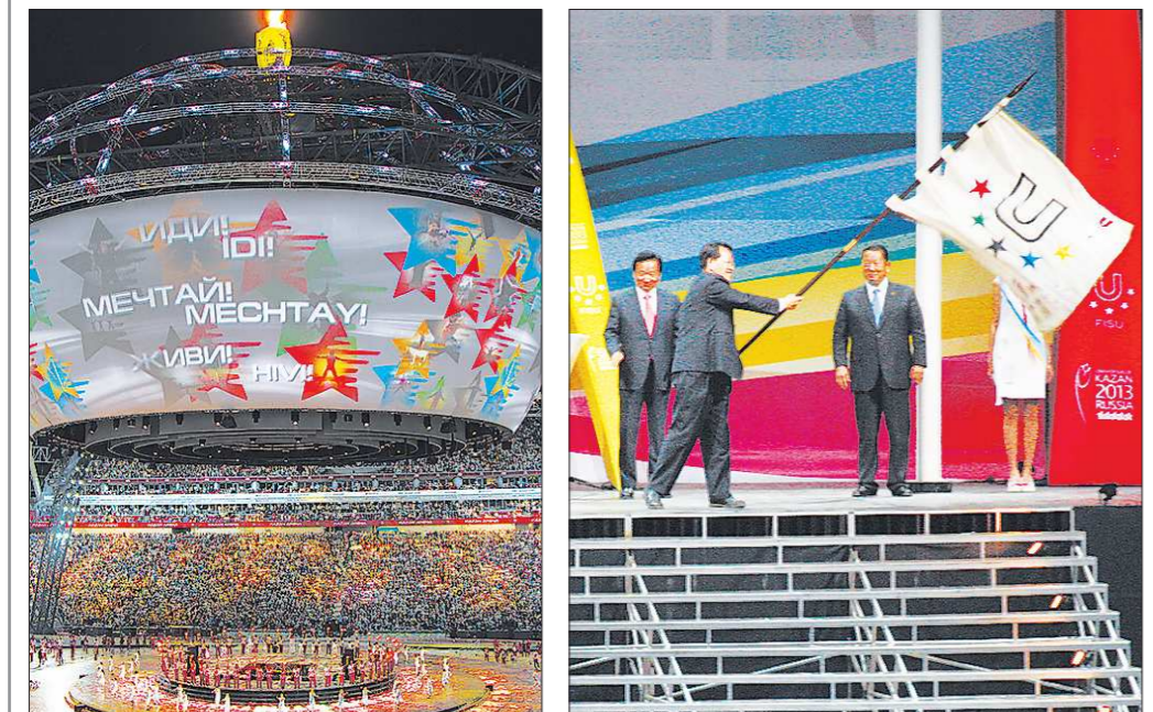
Так увидел закрытие Универсиады в Казани фотокорреспондент «ОГ» Александр Зайцев