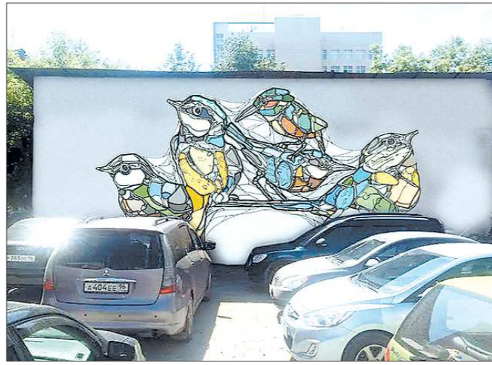
Пока это эскизы, но скоро эти невзрачные здания будут выглядеть именно так. Чтобы разрисовать стену трансформаторной будки или гаража, организаторам пришлось заручиться поддержкой 70 процентов жителей домов по соседству – владельцев этих объектов