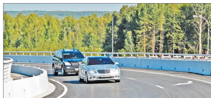
В ближайшие годы в Екатеринбурге и окрестностях за счёт областного бюджета будут построены и реконструированы десятки километров современных автомагистралей

На «Открытой трибуне» говорилось, что Уполномоченным по защите прав предпринимателей должен стать профессионал, который на постоянной основе будет заниматься проблемами бизнес-сообщества.