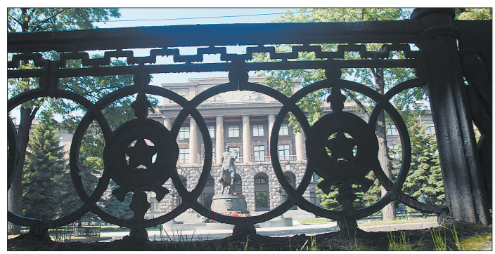
Декоративные ограждения во многом дополняют архитектурную красоту здания штаба Центрального военного округа