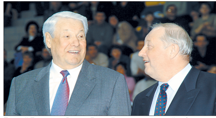
Первый Президент России Борис Ельцин и тогдашний губернатор Свердловской области Эдуард Россель на открытии новой арены в июне 2003 года

А для тех, кто работает в ДИВСе — это даже не вторая, а скорее уже первый дом. Ведь никому не интересно, во сколько на главной арене закончился концерт: утром вместе с музыкальной подготовкой всё подготовлено для тренировок. Как по мановению волшебной палочки, по окончании мини-футбольного матча площадка уже через час готова принять баскетболистов.