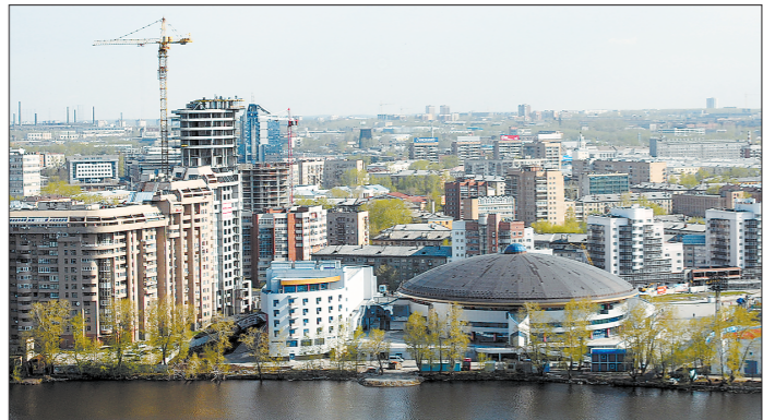
Дворец игровых видов спорта органично вписался в район высотных новостроек на берегу Исеты

Всего за два года возвели это уникальное на тот момент спортивное сооружение. Первым соревнованием, которое прошло в ДИВСе, стал тоже первый