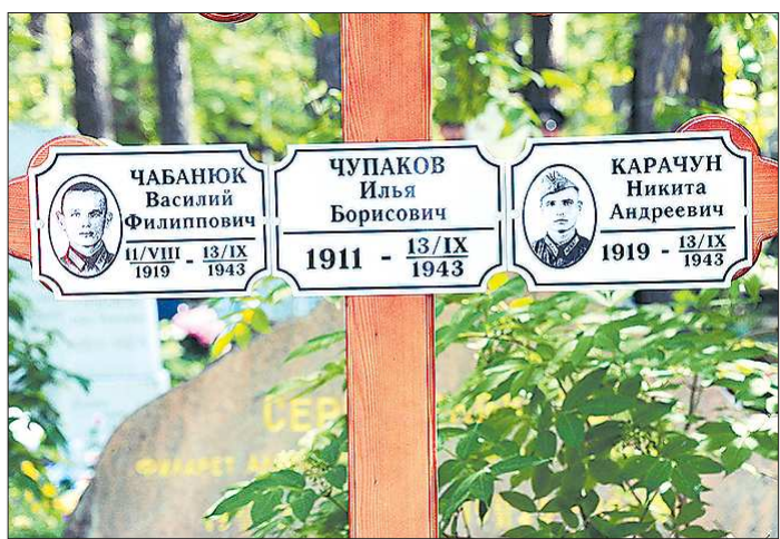
Экипаж бомбардировщика упокоился в братской могиле