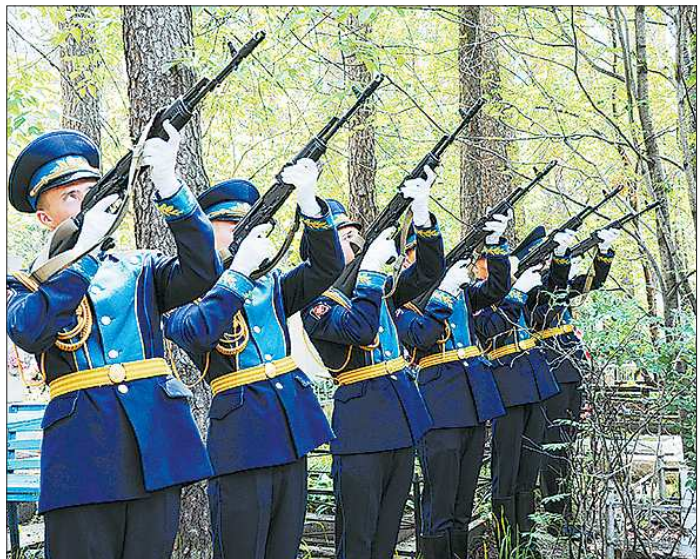
С «воздушными рабочими войнами» простились с воинскими почестями