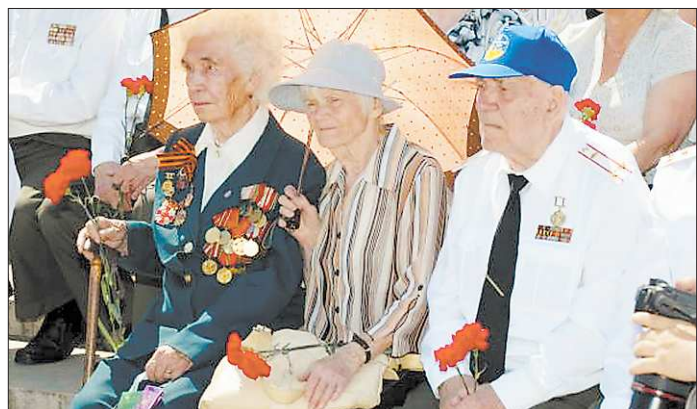
В нашей области осталось около 5200 участников Великой Отечественной войны