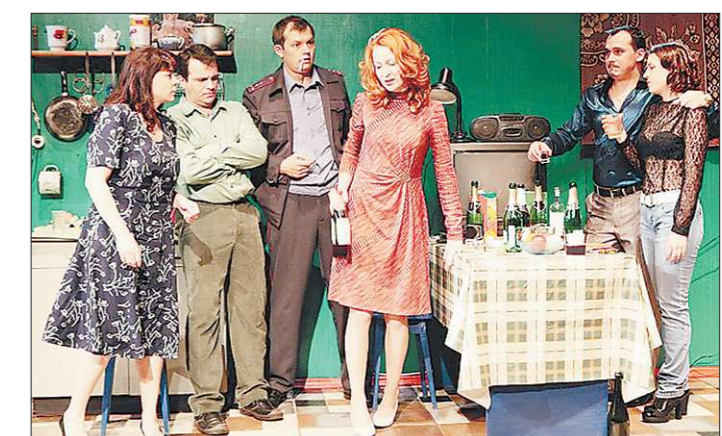
Жанр спектакля «Любовь людей» автор пьесы Дмитрий Богославский определил так: «Картины из жизни людей в преддверии зимы и в ожидании лета»