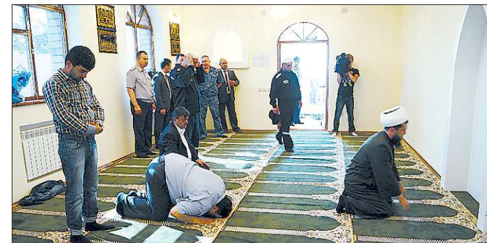
На первую молитву впустили журналистов