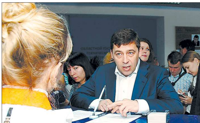
Губернатор Свердловской области Евгений Куйвашев лично проверил работу фронт-офиса, где принимаются заявления уральцев по поводу бесплатного выделения земли

— У нас сегодня в очереди на предоставление земельных