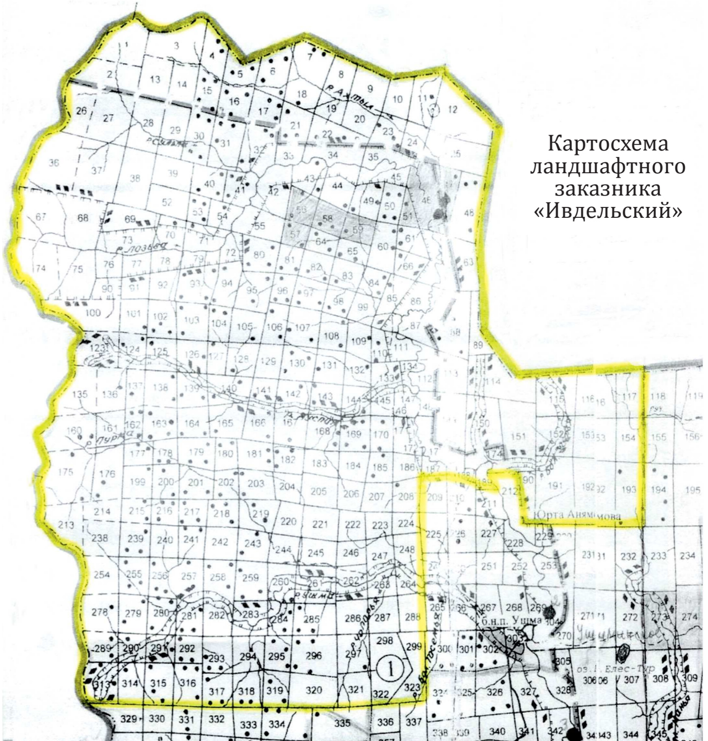
Картограмма ландшафтного заказника «Ивдельский»

Кварталы 1—117; 123—154; 160—193; 199—208; 213—224; 238—248; 254—264; 278—299; 313—323 Вижайского участка Вижайского участка государственного казенного учреждения Свердловской области «Ивдельское лесничество»