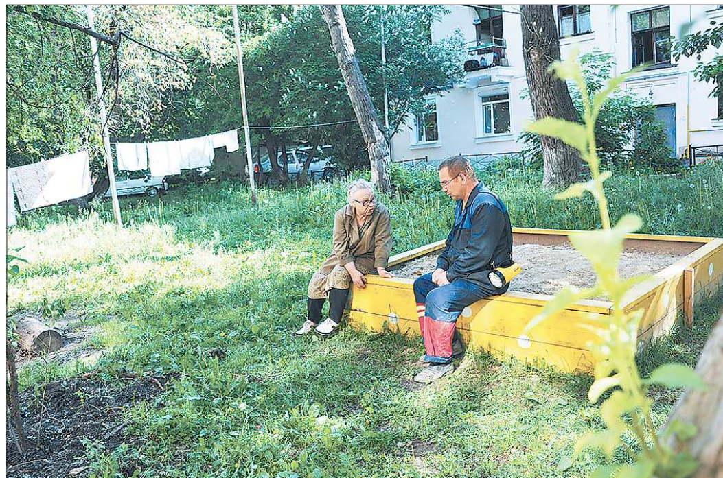
Двор на Мичурина между домами 25 и 23а тихий и зелёный, но в нём нет ни одной скамейки и урны, а бельё жильцы сушат на опорах газопровода

При этом жильцы уверяют, что на днях был вынесен десант коммунальщиков, чтобы прибраться и покра-