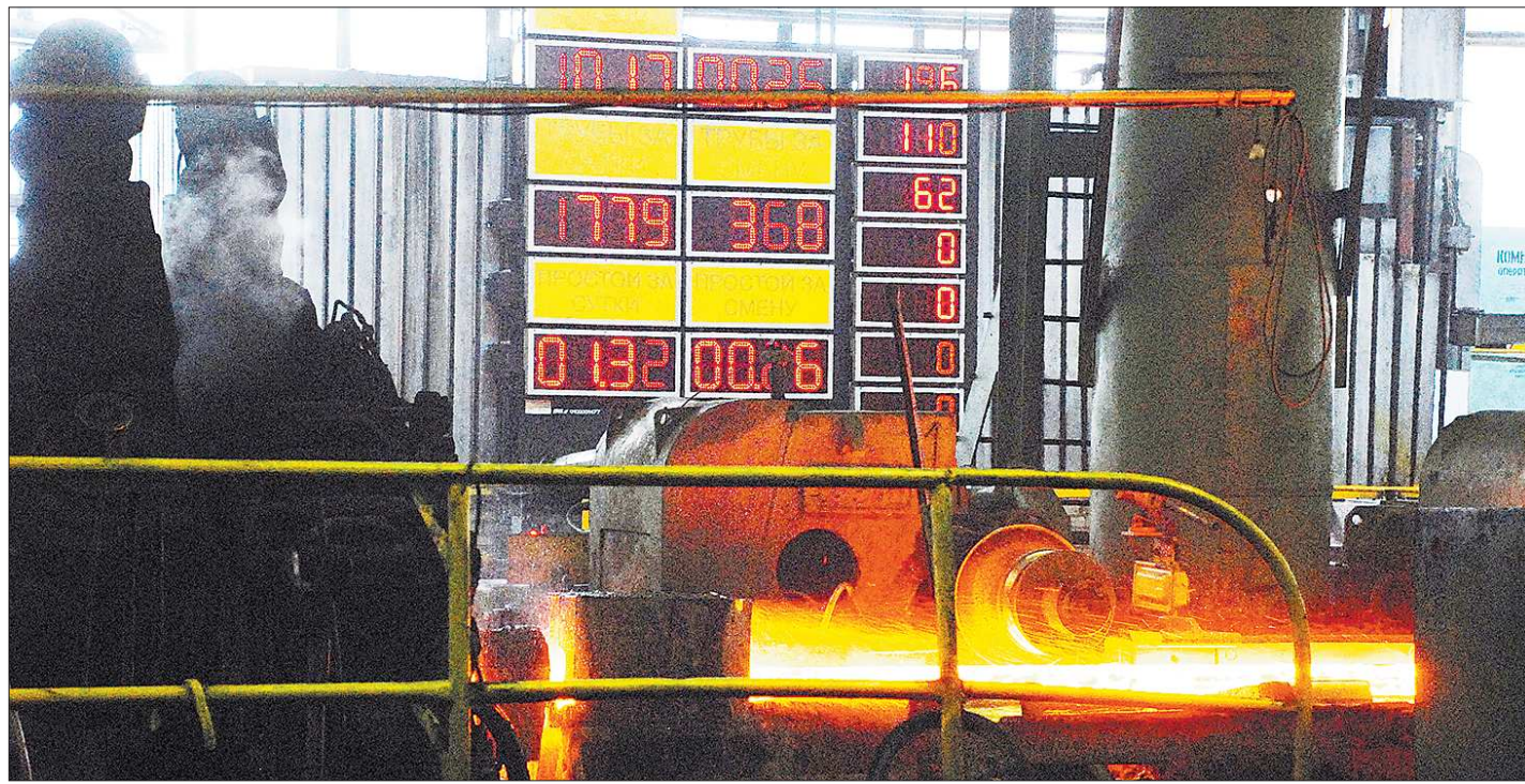
Создание одного рабочего места в базовых индустриальных отраслях даёт в среднем 2,5 рабочих места в смежных непромышленных секторах экономики

«Что новые, что модернизированные рабочие места — это новые технологии и оборудование. Очень важно, чтобы средние и высшие образовательные заведения готовили специалистов, способных в этой технике разбираться, работать на ней и обслуживать её. Поскольку мы при создании рабочих мест по сути обучаем заново тех специалистов, которые у нас работают либо которые к нам приходят, то мы тратим на это достаточно серьёзные средства и создаём общественное благо. К сожалению, система профессионального образования не успевает за теми темпами модернизации, которые осуществляются компаниями. Мы вынуждены этим