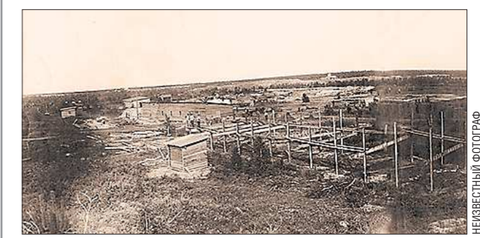
1913 год. Первые дни строительства