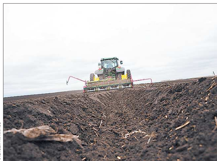
Яровой сев в этом году вырос в 2,4 раза и составил по итогам 2012 года 900 миллионов долларов США. Общий объём рынка компьютерных игр при этом составил 1,3 миллиарда долларов.

Если квартира не приватизирована, заплатить за перепрограммирование обязан муниципалитет.