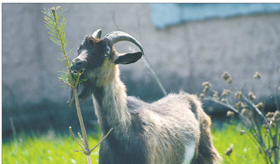
Пошалили шалинские козы. И ещё не прочь пошалить...

Тем временем ГУ МЧС России по Свердловской области сообщает, что проливные дожди будут идти на Среднем Урале до середины следующей недели. Спасатели предупреждают о возможном подьёме воды в малых реках — получается, что и горожане должны быть начеку.