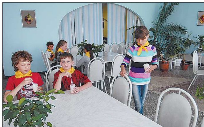
Художественное оформление «ФрутЛэнда» – дело рук самих лицензистов и педагогов

В лицее №180 Чкаловского района Екатеринбурга для младших школьников организовали витаминный буфет «ФрутЛэнд». В столовой соседнего здания для обучающихся в 5-11 классах работает интернет-кафе «Город». И во время обеда, и после уроков в школьных точках общепита многолюдно. Да и на каникулах, как выяснили корреспонденты «ОГ», буфет и кафе гимназии не пустуют.