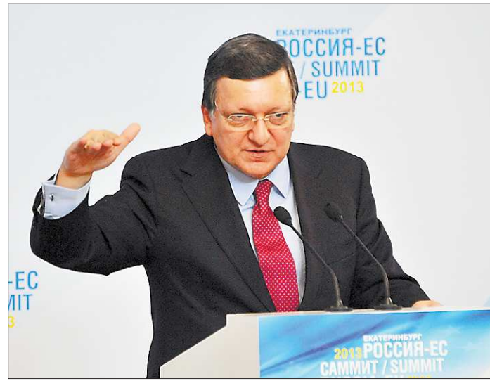
Жозе-Мануэль Баррозу: «Урал уже стал не границей, а мостом между Европой и Азией»

«Хотел бы поблагодарить руководство и членов Евросоюза за поддержку Екатеринбурга в качестве столицы Всемирной универсальной выставки», — сказал Владимир Путин.