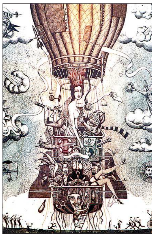
Душан Полакович. «Воздухоплаватели», 2010 г.