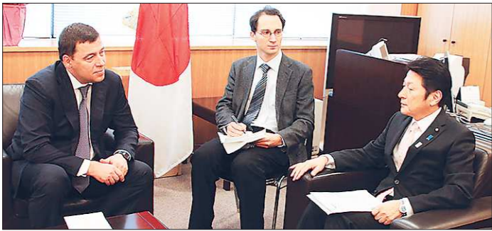
Губернатор Евгений Куйвашев и первый заместитель министра иностранных дел Японии Масадзи Мацуяма обсуждают возможность открытия на Урале дипломатического представительства Японии