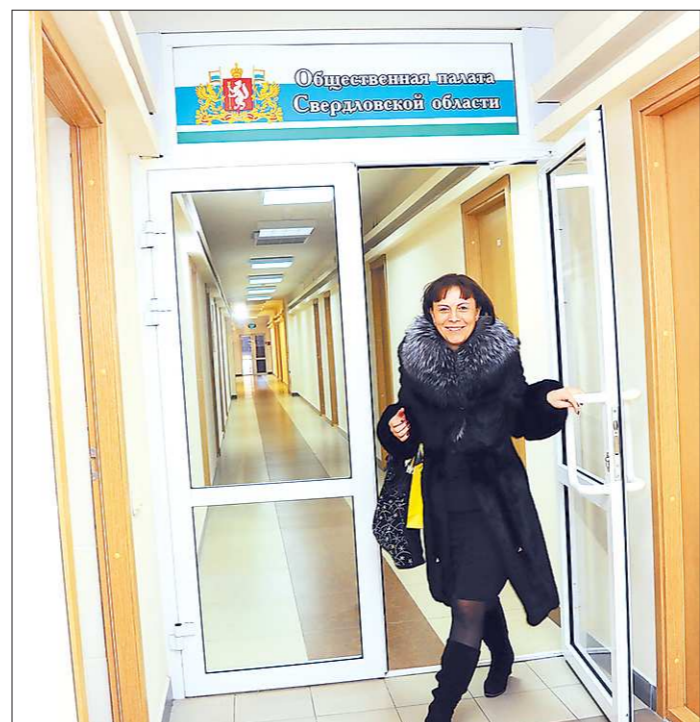
Посетителей в Общественной палате принимают в течение всего рабочего дня за исключением обеденного перерыва

Среди обращений в этот гражданский орган – и экология (к примеру, недавно житель Сосьвинского городского округа сообщил о захламлённости местных лесов), и проблема сохранения исторического облика уральской столицы, и вопросы жилищно-коммунального хозяйства (эта горячая тема собрала больше всего обращений свердловчан). Практически по каждой стороне жизни региона в Общественной палате работают специальные комиссии: от развития агропромышленного комплекса до межрегиональных отношений и свободе совести.