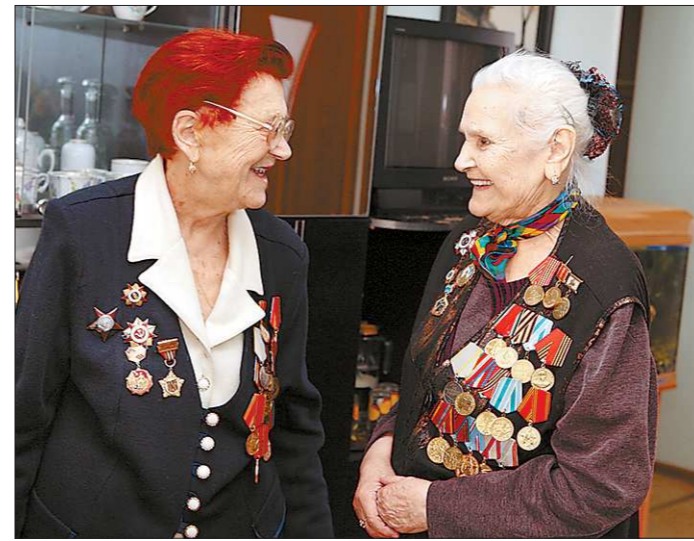
Активистки клуба «Фронтовичка» по-прежнему в строю

В центре соцобслуживания «Золотая осень» прошла встреча активисток клуба «Фронтовичка». Несмотря на преклонный возраст (многим уже за 90) женщины, прошедшие войну, ведут воспитательную работу в школах, участвуют в общественной жизни Дзержинского района. Свою февральскую встречу фронтовички посвятили истории Уральского добровольческого тан-