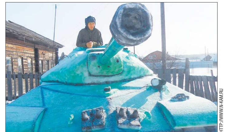
Автор торопился слепить своего «снеговика» к 23 февраля, а теперь волнуется, чтобы местная ребятня не разбомбила его до праздника