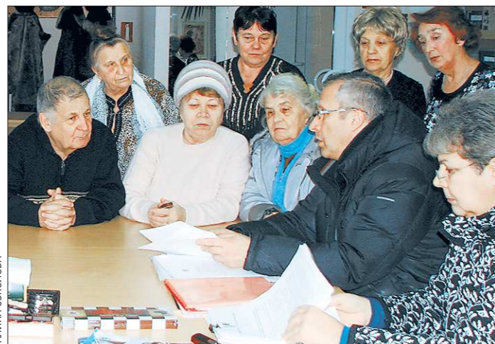
Завершив эпопею с оплатой отключения, пенсионеры занялись тарифами на электричество. Получен ответ на запрос из мнррегиона РФ

Активисты организации особенно гордятся тем, что