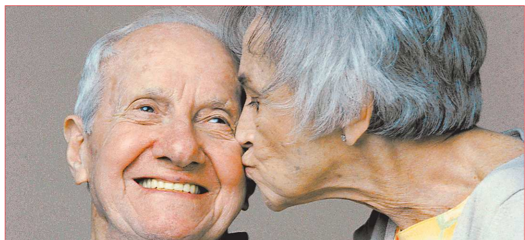
Насколько больше было бы у нас счастливых пар, если бы мужчины не стеснялись лечиться, а медки были к ним внимательнее