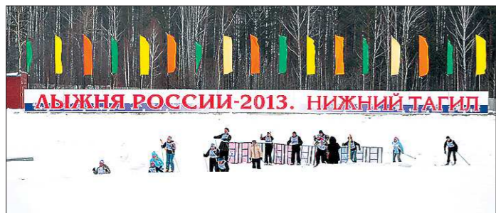
Трасса на полигоне «Старатель» не меняется уже несколько лет