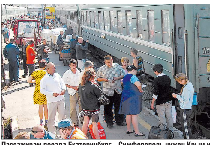
Пассажирам поезда Екатеринбург – Симферополь нужен Крым и море, а не «забавы» украинских политиков