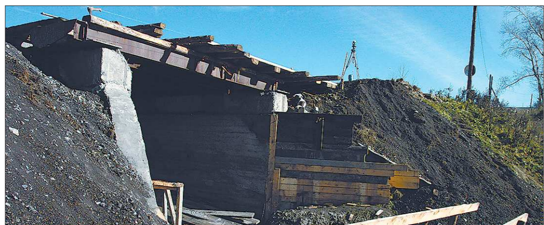
Можно выдать миллион на полмоста. Только по нему не проедешь и на копейку