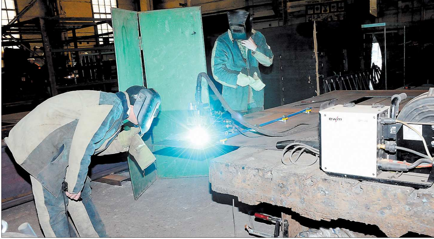
Тойота, Хонда, Крайслер делегируют сторонним организациям порядка 70 процентов бизнес-процессов...