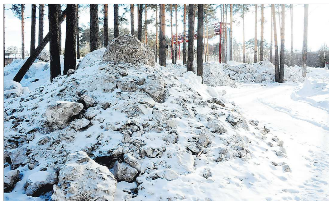
По словам лесничих, и раньше случалось встречать здесь одну-две кучи такого снега, но тут — целая горная гряда, а в ней вся таблица Менделеева. Если растает, лесопарку и людям не поздоровится

ОТ РЕДАКЦИИ. Как только окончательное решение о судьбе посёлка будет принято, мы расскажем о пуксинской истории подробнее.