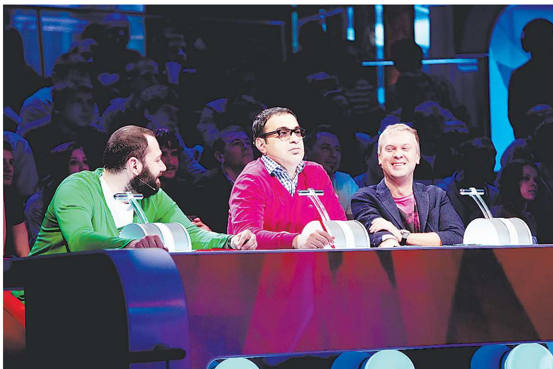
«Comedy Баттл» – юмористическое шоу, которое делится на две части: «Comedy Баттл. Кастинг» и «Comedy Баттл. Турнир».

Взгляд падает на таинственную комнату. Там идёт телесъёмка выступлений. Диск с видео уедет в Москву, его будут