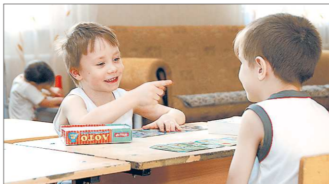
Во многих детдомах Урала для воспитанников созданы хорошие условия