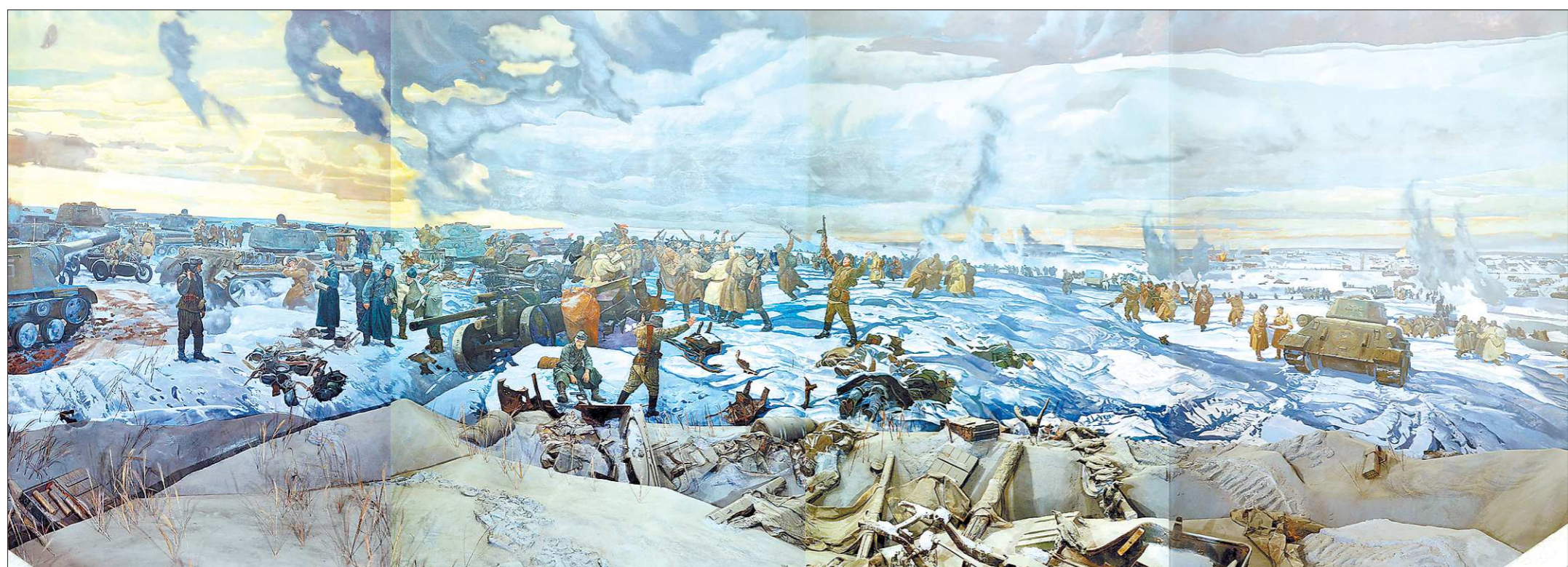
Сталинградская битва — крупнейшая сухопутная битва в ходе Великой Отечественной войны.

Она началась 17 июля 1942 года. Фашистские войска попытались захватить левобережье Волги в районе Сталинграда и сам город, однако не смогли этого сделать. Поздней осенью Красная армия перешла в контрнаступление, в результате ко-