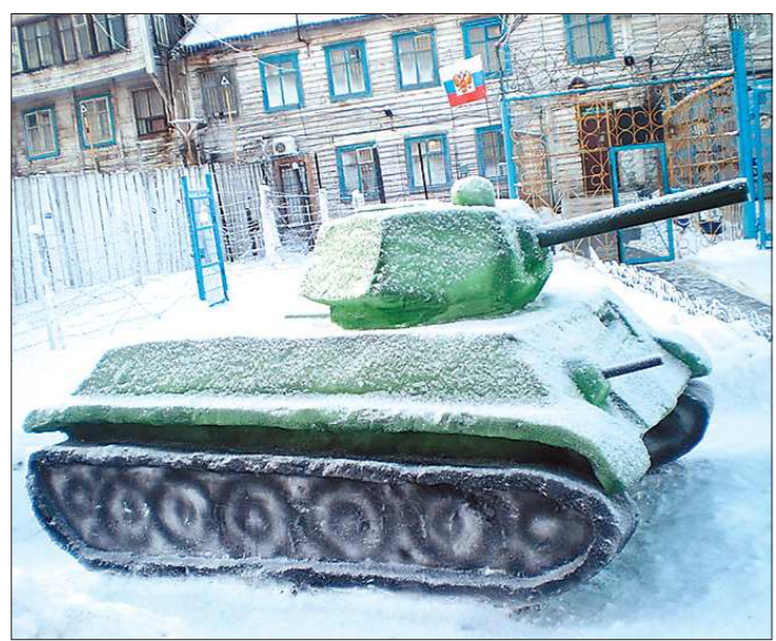
Этот танк – штучный экземпляр, а в годы войны каждые 40 минут новенький Т-34 сходил с конвейера в Нижнем Тагиле

Снежный же танк красуется в натуральную величину на импровизированном постаменте возле здания штаба колонии. Администрация ЛИУ-23 жалеет, что весной снежная машина растает. Возможно, они попросят заключённых, чтобы они воссоздали Т-34 уже не из снега, а из другого более прочного материала: камня или песка.