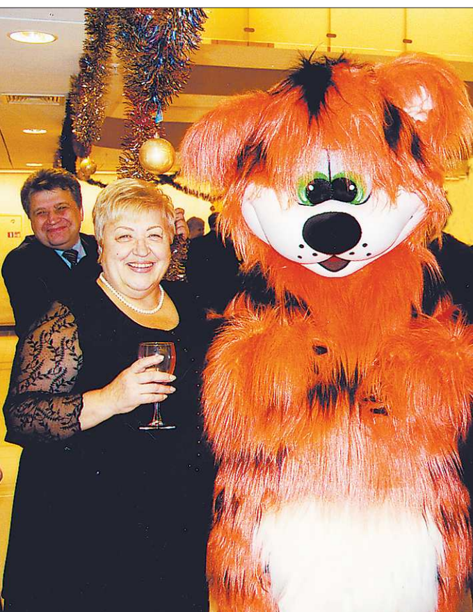
Встреча нового, 2011 года, в Законодательном Собрании