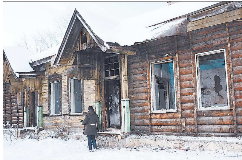
Пять семей из этого барака (на фото слева), как и многие другие сухоложцы. Новый год справят здесь (на фото справа)