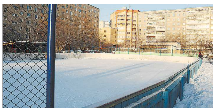
На заливку такого катка, как по улице Агрономической в Екатеринбурге, обычно требуется несколько тысяч рублей