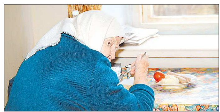
Пенсионные накопления поддержат в старости

В проекте ещё многое может появиться нового до его принятия в следующем году. Но вряд ли изменится сложившаяся в него идеология. Это, прежде всего, более строгая, по сравнению с нынешней, процедура получения пособия.