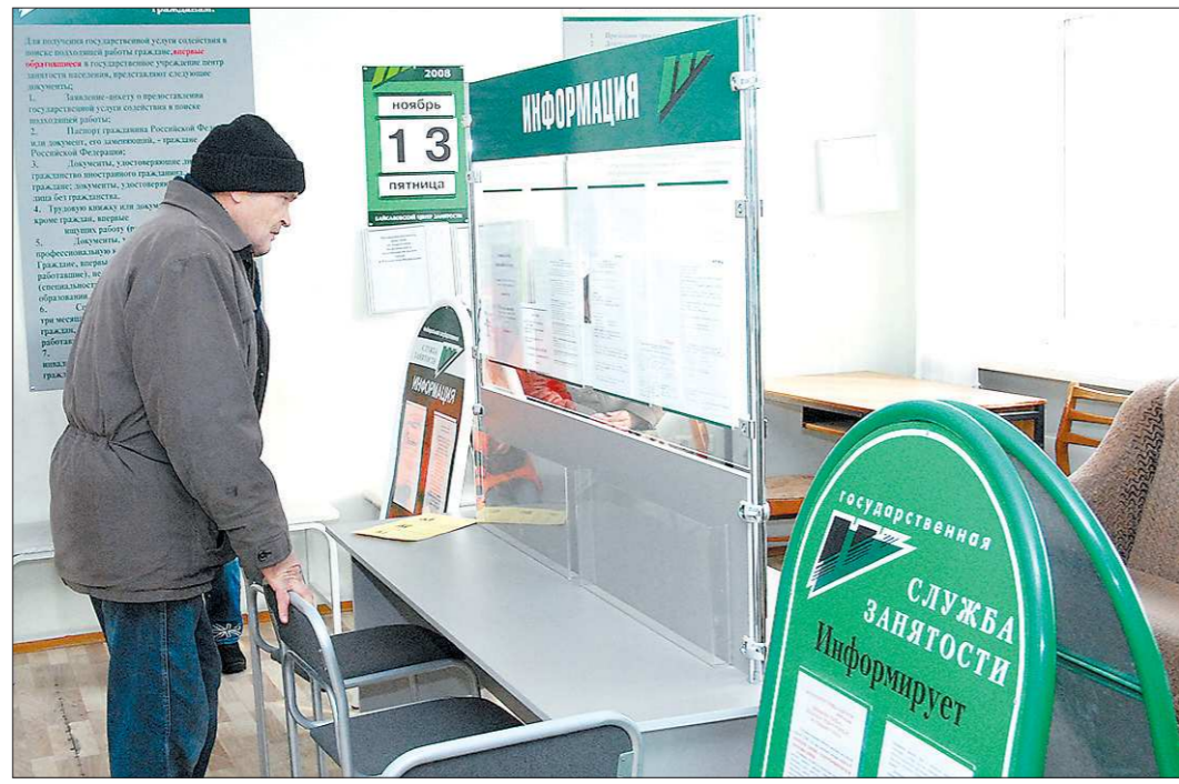
У многих безработных пособие превратилось в зарплату

Формально существующий порядок таков, что на максимальное пособие уволенный работник может рассчитывать только один год после того, как оказался безработным и встал на учёт на биржу труда.