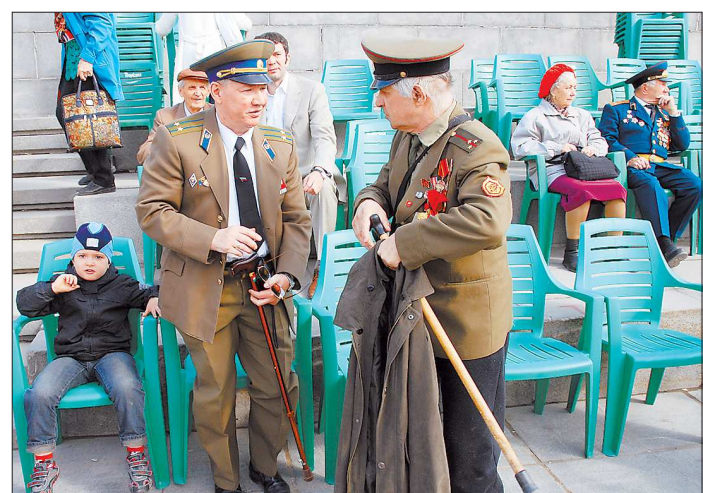
Всё-таки ждём хорошую пенсию

Следует напомнить, что ещё с советских времён пенсионное право проходить лечение в военных госпиталях и поликлиниках, санаториях и профилакториях отставным военным в нашей стране предоставляется как одна из льгот за многолетнюю добросовестную службу. В СССР получить такое право мог лишь офицер, прослуживший в армии не менее 25 лет. В новой России обязательный стаж службы, дающий эту льготу, был снижен до 20 лет. Но если раньше военные госпитали или поликлиники имелись фактически в каждом областном центре, то после проведённой в последние годы оптимизации военно-врачебной сферы в 17 субъектах РФ вообще не осталось армейских лечебных учреждений. В результате сотни тысяч военных пенсионеров лишились права ведомственной медицинской помощи, что вызвало критику нового министра обороны. «Любые изменения в этой сфере не должны приводить к ухудше-