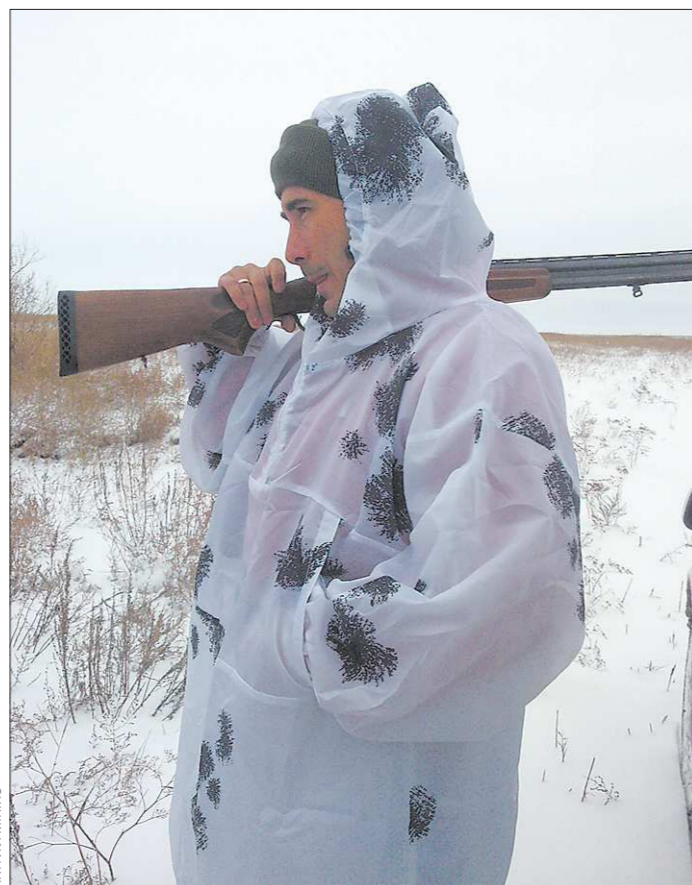
Как ни обидно, но если нет «бумаги» – так охотники в просторечии называют лицензию – всё, стволы назад