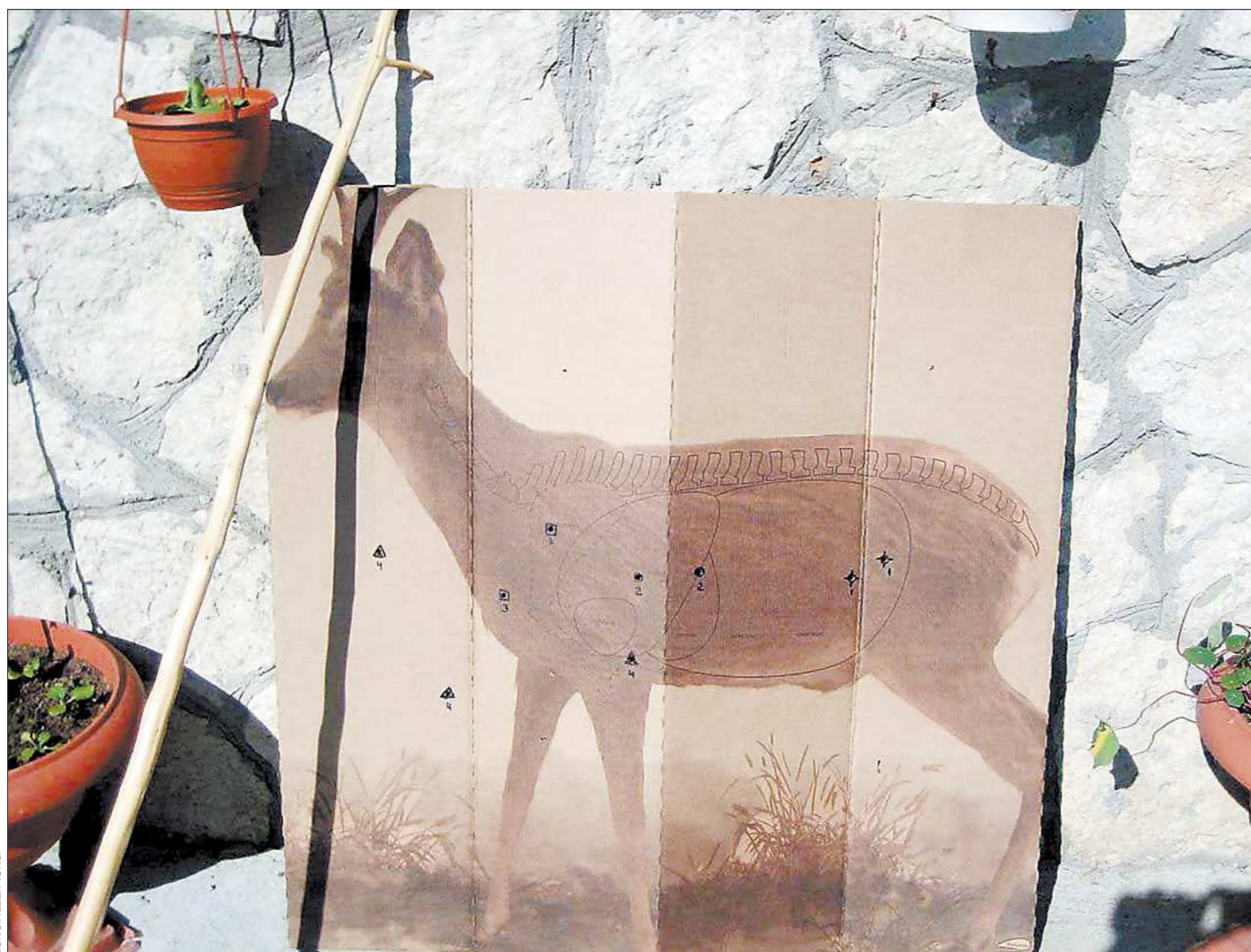
Осенне-зимний, самый массовый охотничий сезон в разгаре. Но тем, кто не сумел взять лицензию, придётся стрелять только по мишеням...

Ну и приступили к собственно жеребьевке. Рассмотрим этот процесс на примере столь милого серд-