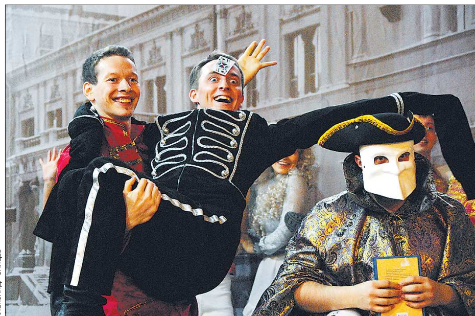
Артисты театра перенесли из произведения Пушкина в свою постановку не только практически дословный текст, но и атмосферу Германа

В финале артисты театра передали жестами, с помощью пластики тела телесно «Прекрасное далёко», которую они нашли в исполнении глухонемых в Интернете.